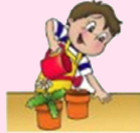
Tâches et consignes

Je peux écrire un message à l'aide de mots et de pictogrammes.